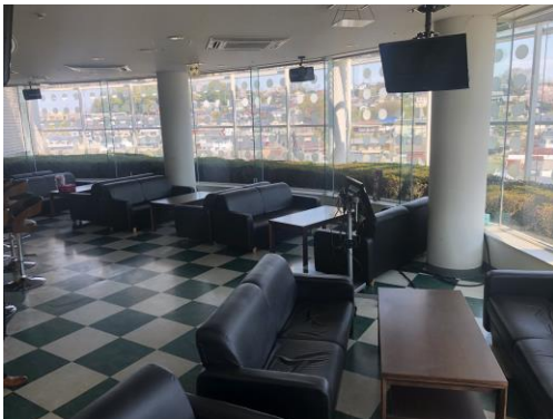
(物件の現在の様子)